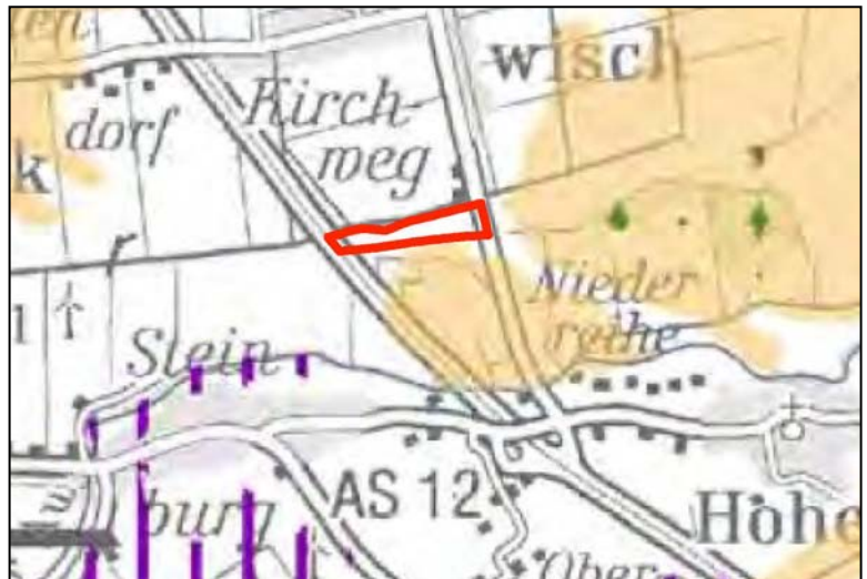
LRP 2020 Hauptkarte 3 (Kartenausschnitt)

(4) Gemäß der Hauptkarte 3 des LRP 2020 grenzt das Plangebiet im Süden an einen Bereich mit klimasensitiver Böden.