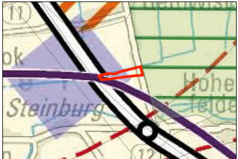
LEP 2010 (Hauptkarte Ausschnitt)

(3) Gemäß der Karten-Darstellung des LEP liegt das Plangebiet „Solarpark Rethwisch“ im ländlichen Raum und im 10km-Umkreis des Mittelzentrums Itzehoe. An der südwestlichen Spitze des Plangebietes wird eine Leitungstrasse (220 kV) berührt. Hinsichtlich des geplanten Solarparks enthält der LEP weder widersprechende noch vorbereitende Aussagen.