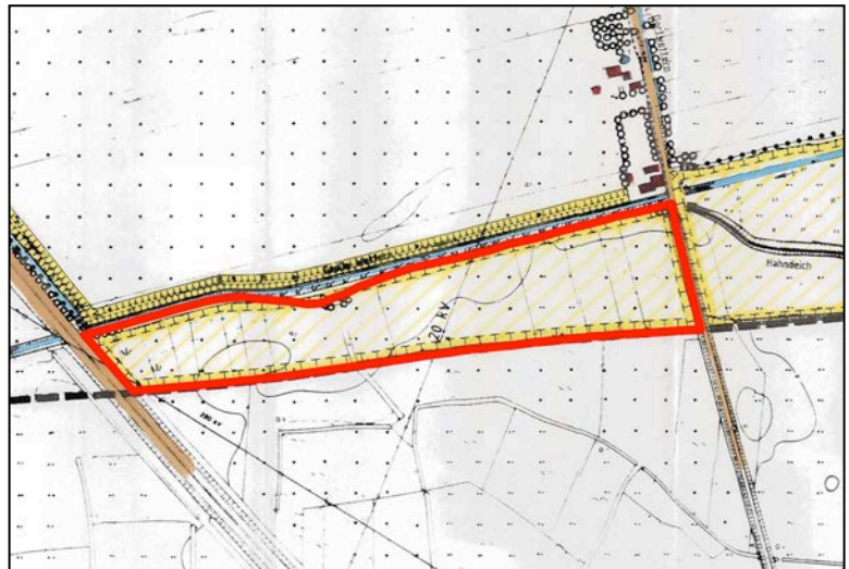
LP 1997 (Ausschnitt)

(2) Gemäß dem Erläuterungsbericht zum LP ist die dargestellte Maßnahmenfläche zwischen dem Weg Wischdeich und der südlichen Gemeindegrenze als Teil einer Verbundachse bzw. eines zu entwickelnden örtlichen Biotopsystems zu verstehen. Dabei war der Bereich südlich des Weges bis zur Gemeindegrenze als Sukzessionsfläche geplant worden. Diese Nutzungsänderung war jedoch nicht genauer begründet und nicht weiterverfolgt worden. Realisiert wurde zwischenzeitlich aber die Ergänzung einzelner vorhandener Feldgehölze entlang der Neuenbrooker Hauptwettern zu einer geschlossenen Baum-Strauchhecke.