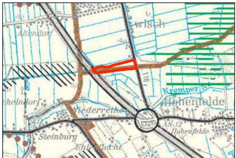
Regionalplan 2005 Planungsraum IV (Kartenausschnitt)

(2) Hinsichtlich der Entwicklung der Solarenergie gibt der Regionalplan weder Entwicklungsziele noch Beschränkungen vor. Im Kapitel 7.4 „Energiewirtschaft“ (Abs. 10) stellt der Regionalplan in Bezug auf die Solarenergie klar, dass Verbesserungen der Technologie und des Materialeinsatzes sowie eine Erhöhung der Einspeisevergütung nach dem EEG dazu beitragen sollen, dass sich ein Markt von Angebot und Nachfrage in breiterer Form bildet“.