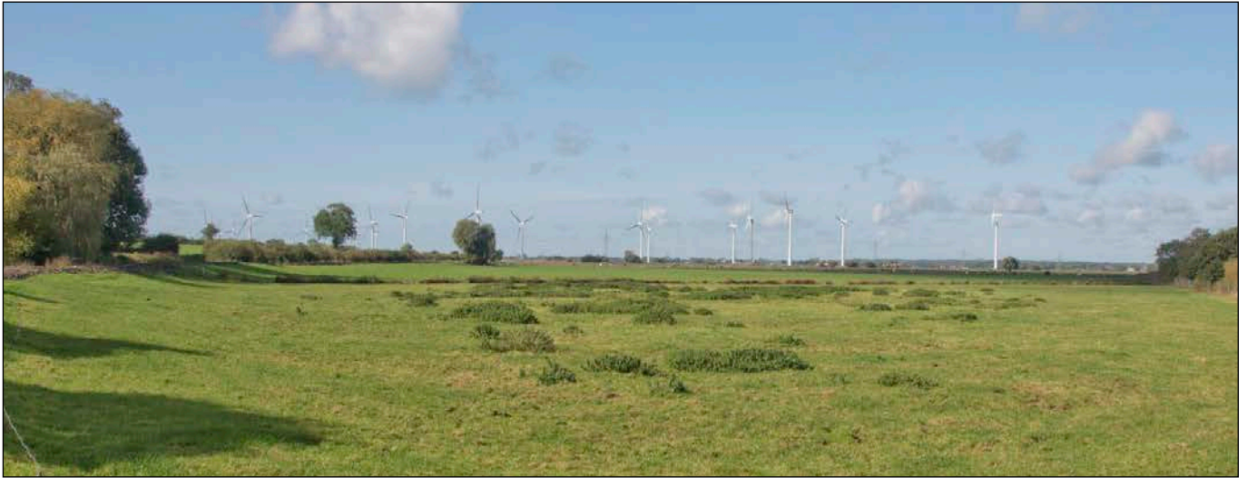
Blick über das Plangebiet in nordwestliche Richtung

- Fotografische Bestandsaufnahme am 09.10.2020 -