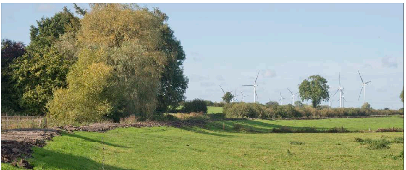
Blick in westliche Richtung