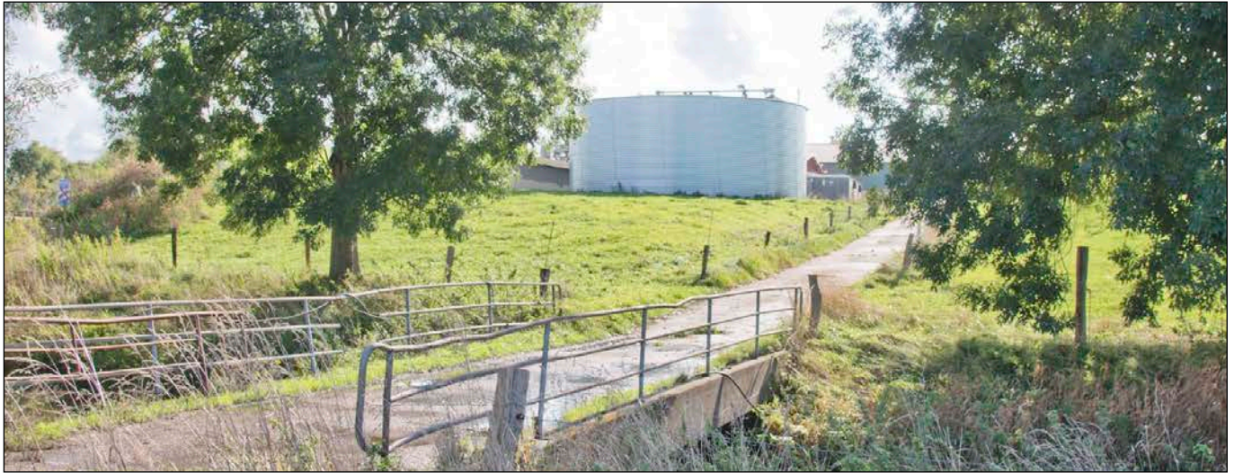
Blick in südliche Richtung - Brücke über die Kremper Au

- Fotografische Bestandsaufnahme am 09.10.2020 -