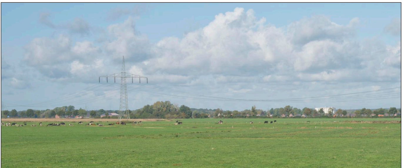
Blick über das Plangebiet in nördliche Richtung