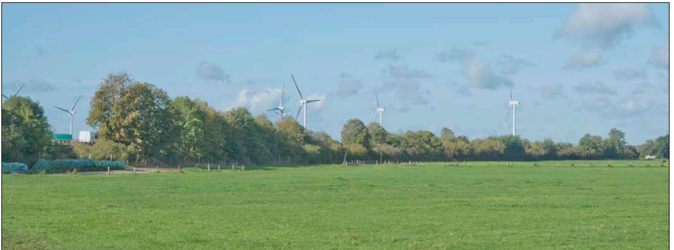
Randbepflanzung an der Autobahn A23 - Blick in nordwestliche Richtung