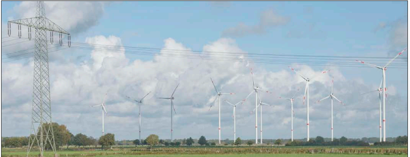
Blick über das Plangebiet in nordöstliche Richtung über die Landesstraße L116 hinweg

- Fotografische Bestandsaufnahme am 09.10.2020 -