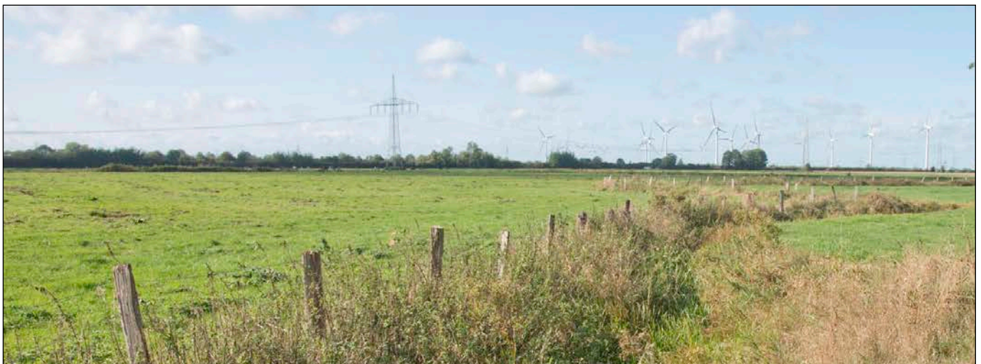
Mühlenuwetterern östlicher Abschnitt an der L116 - Blick in westliche Richtung