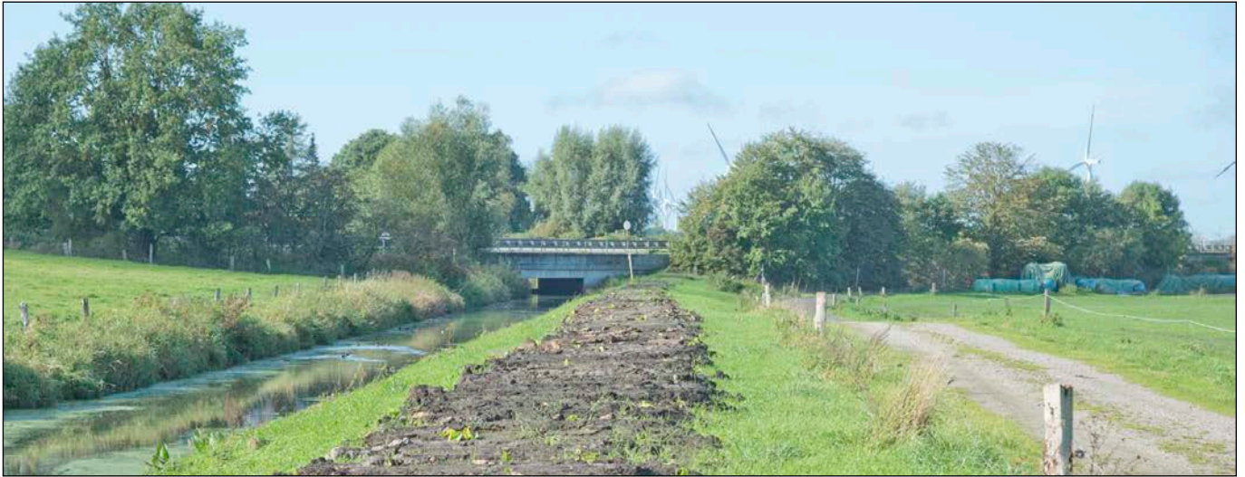
Südliche Plangrenze - Kremper Au - Blick in westliche Richtung

- Fotografische Bestandsaufnahme am 09.10.2020 -