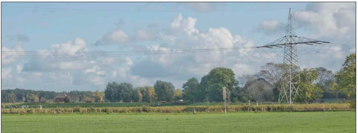
Blick über das Plangebiet in östliche Richtung über die Landesstraße L116 hinweg