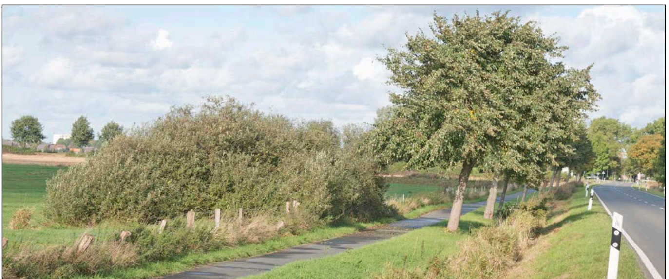
Feldgehölz mit Weidensträuchern an der L116 - Geh- und Radweg - Straßenbäume - Graben - Landesstraße L116