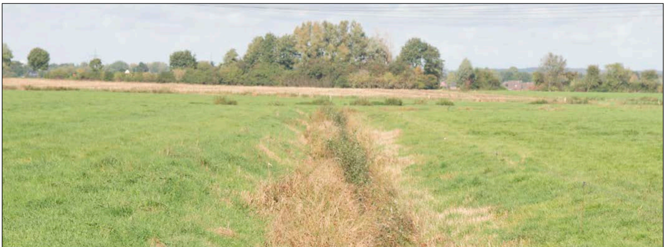
Blick in nördlicher Richtung über die Mühlenuwettern