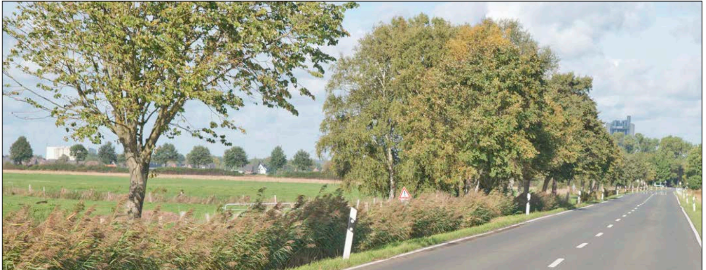
Feldgehölze an der L116 - Blick in nordwestliche Richtung

- Fotografische Bestandsaufnahme am 09.10.2020 -