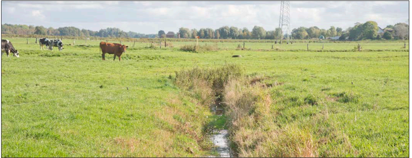
Blick vom Wirtschaftsweg im Westen über die Mühlenuwettern (vor dem verrohrten Teilstück)

- Fotografische Bestandsaufnahme am 09.10.2020 -