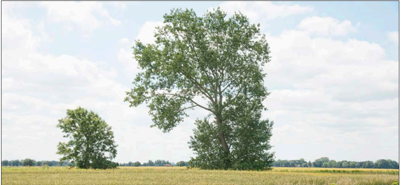
Feldgehölze am Westufer und Nordufer der Neuenbrooker Wettern - Blick nach Nordwesten

- Fotografische Bestandsaufnahme am 14.07.2020 -