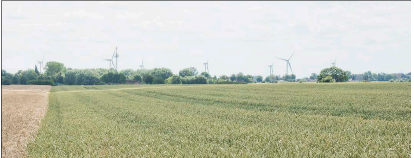
Blick über das Plangebiet in südsüdwestliche Richtung in Höhe der Gemeindegrenze zur Stadt Krempe

- Fotografische Bestandsaufnahme am 14.07.2020 -