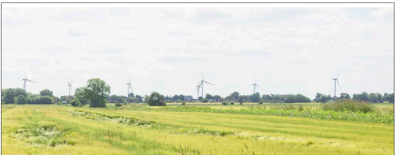
Blick in südliche Richtung über den westlichen Teil des Plangebietes